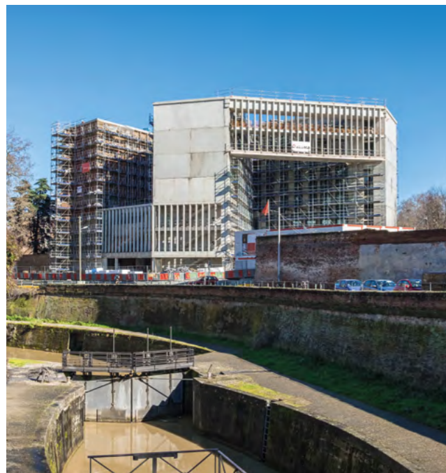
Le nouveau bâtiment devant accueillir TSE en cour d'achèvement